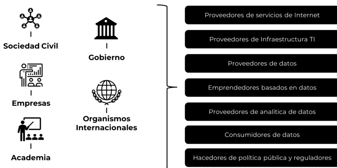
Figura 2. Actores y roles del ecosistema

Posteriormente, se debe definir el rol que desempeña cada uno de los actores establecidos dentro del ecosistema, para ello se puede hacer un ejercicio de identificación de acuerdo con el contexto y los propósitos generales del agente, sin embargo, es importante crear un mecanismo que permita a los stakeholders reconocer sus funciones dentro del ecosistema. En ese sentido vale la pena recordar el tipo de agentes y de roles mencionados en la caracterización del ecosistema de datos en Colombia (ver Figura 2).